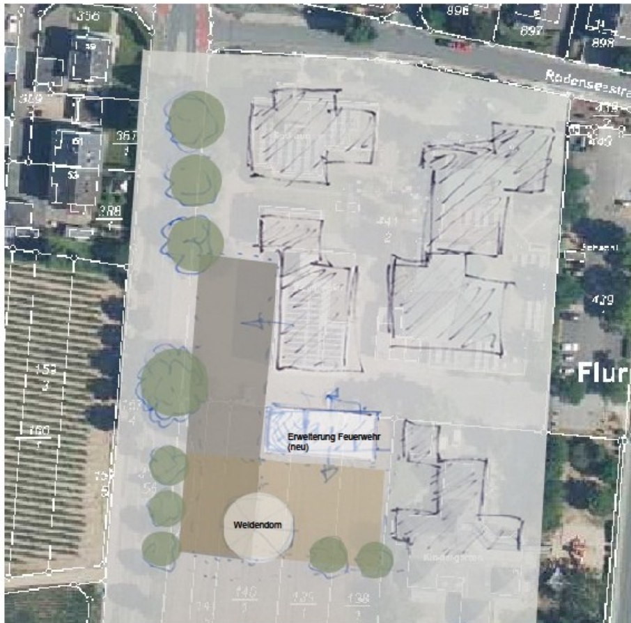
Entwicklung öffentlicher Plätze | Vorstellung der Arbeitsergebnisse 30.10.2018

AG1, Projekt 1: Öffentliche Plätze Beispiel: Ortseingang Feuerwehr